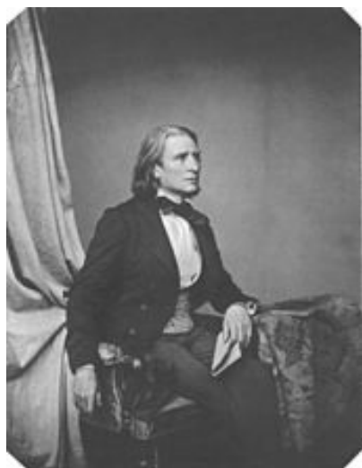
Franz Liszt en 1858 par Franz Hanfstaengl